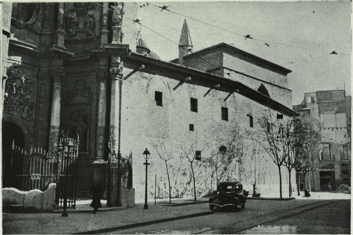
El nuevo terminal de la Catedral contiguo a la portada barroca de Vergara.

Aprovechamiento al máximo del espacio disponible por buena relación: acera, calzada, jardín, aparcamiento, situando al propio tiempo en la plaza elementos que eviten un aspecto desértico, sobre todo bajo el ardiente sol de verano.